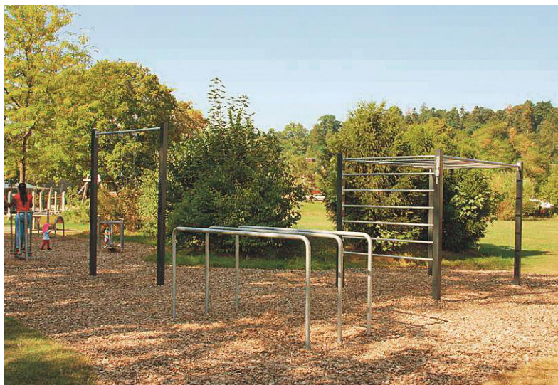
Eine Streetworkout-Anlage wie in Reinach wird auch in Sissach aufgestellt – siehe Geschäfte der Gemeindekommission.

• Strasse inklusive Beleuchtung: 390'000 Franken (Investitionsplan: 300'000 Franken)