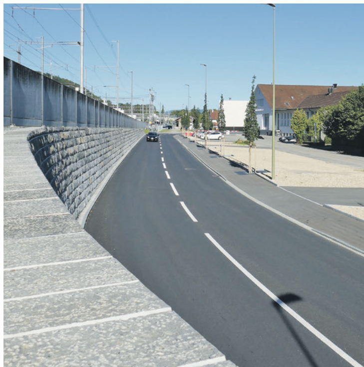
Güterstrasse vorher (links) und nachher (rechts).

Am 19. August wurde das Bauprojekt Güterstrasse bei einer Begehung vor Ort abgenommen. Alle am Bau Beteiligten dürfen einen Erfolg verbuchen.