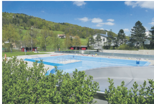
Das Schwimmbad Sissach am 19. April.