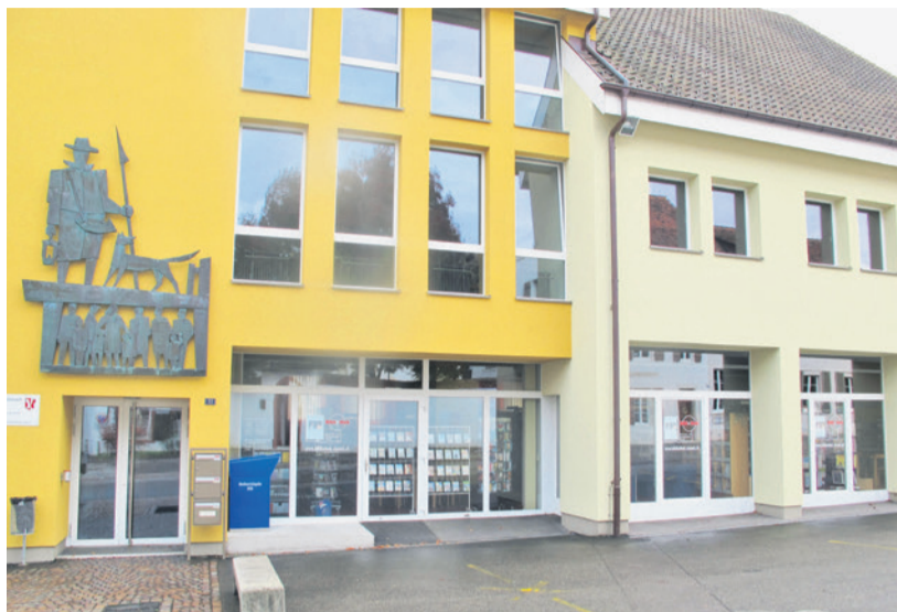
Wohl im alten Feuerwehrmagazin: die Bibliothek.

Mit «e-ubl» – ein digitales Angebot der Kantonsbibliothek Baselland – stehen den Nutzern zusätzlich auch digitale Medien zur Verfügung. Die Bibliothek Sissach ermöglicht allen eingeschriebenen Personen gratis einen Zugang zu einer Vielzahl an Büchern, Filmen, Musiktiteln und Hörbüchern im Netz – zum online Geniessen oder Herunterladen auf diverse Endgeräte. Die Bibliothek Sissach ist innovativ und