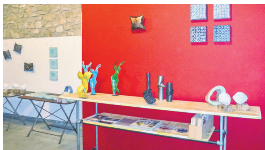
Zweimal Einblick in den Nischenmarkt 2013.